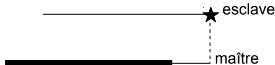
Figure 3.1.5-1: Projection d'un nœud esclave en dehors d'une maille maître

Dans certaines situations, il peut être nécessaire d'étendre de manière fictive les mailles de la surface maître. Prenons le cas du contact en 2D sur la Figure 3.1.5-1 (les surfaces de contact sont donc des segments), on se place sur le bord de la surface de contact. La projection d'un nœud esclave tombe en dehors de la surface maître.