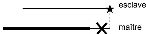
Figure 3.1.5-2: Exclusion d'un nœud esclave

Une solution consiste alors à ne pas appairer le nœud, ce qui revient à l'exclure du contact :